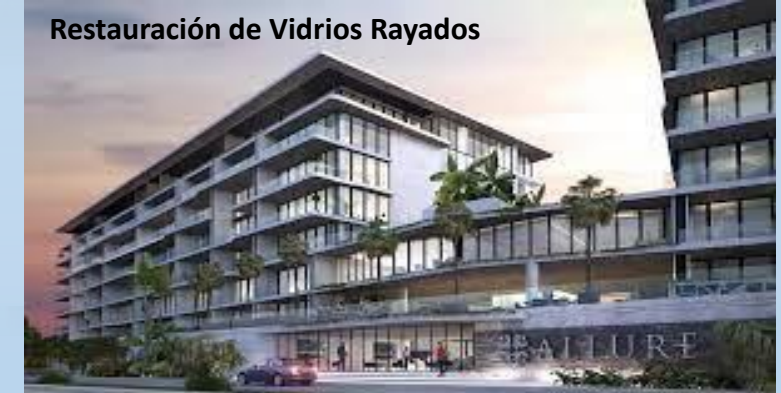
Restauración de Vidrios Rayados

The Landmark Guadalajara. Guadalajara, Jalisco.