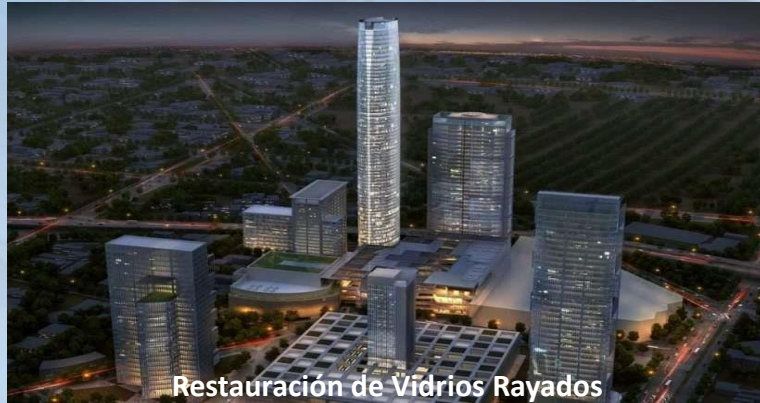
Restauración de Vidrios Rayados