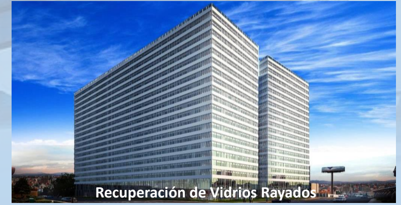
Recuperación de Vidrios Rayados