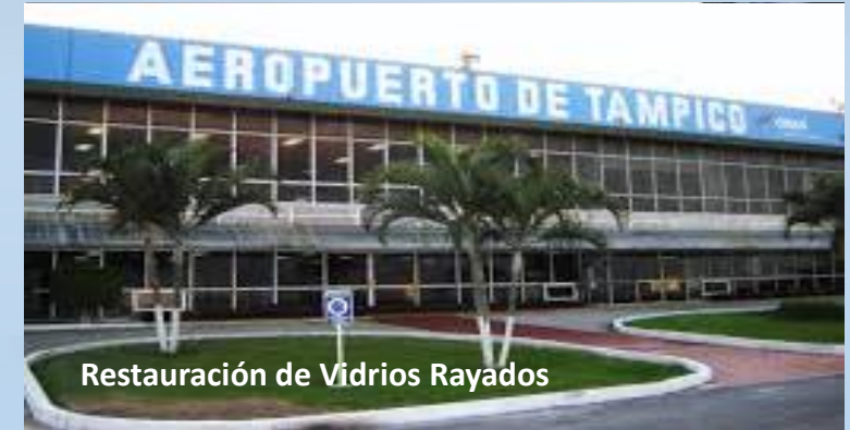
Restauración de Vidrios Rayados

Torre Panorama Acueducto Guadalajara, Jalisco.