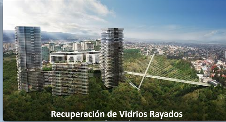
Recuperación de Vidrios Rayados

Residencial Alta Vitta Lomas Verdes, Edo Méx.