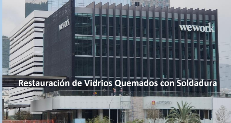
Restauración de Vidrios Quemados con Soldadura

WeWork, Distrito Armida San Pedro Garza García, N.L.