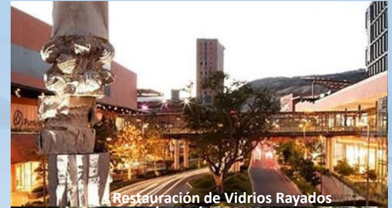
Restauración de Vidrios Rayados

Torre Malva, Distrito Armida San Pedro Garza García, N.L.