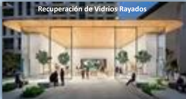
Recuperación de Vidrios Rayados