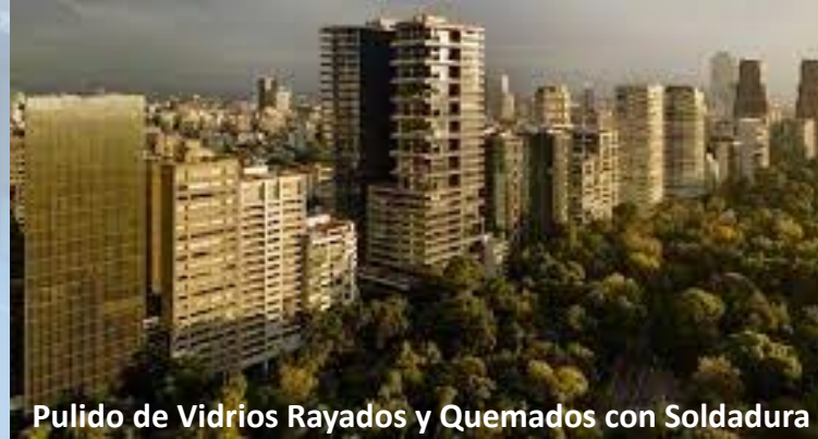
Pulido de Vidrios Rayados y Quemados con Soldadura