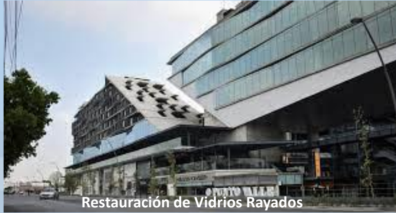
Restauración de Vidrios Rayados

Centro Comercial Punto Valle San Pedro Garza García, N.L.