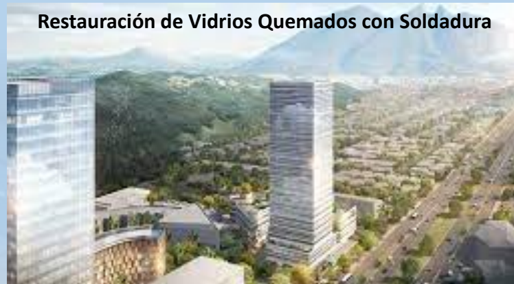
Restauración de Vidrios Quemados con Soldadura

Centro Comercial Punto Valle San Pedro Garza García, N.L.