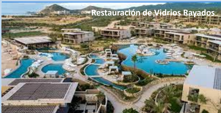
Restauración de Vidrios Rayados

Plaza Comercial Punto Sur Tlajomulco de Zuñiga, Jalisco