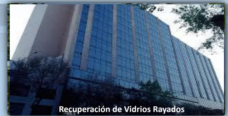
Recuperación de Vidrios Rayados