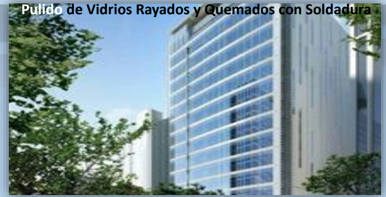
Pulido de Vidrios Rayados y Quemados con Soldadura