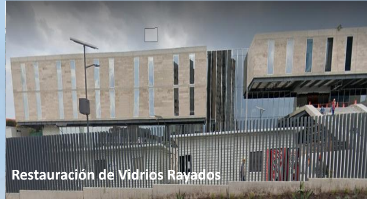
Restauración de Vidrios Rayados

WeWork, Distrito Armida San Pedro Garza García, N.L.