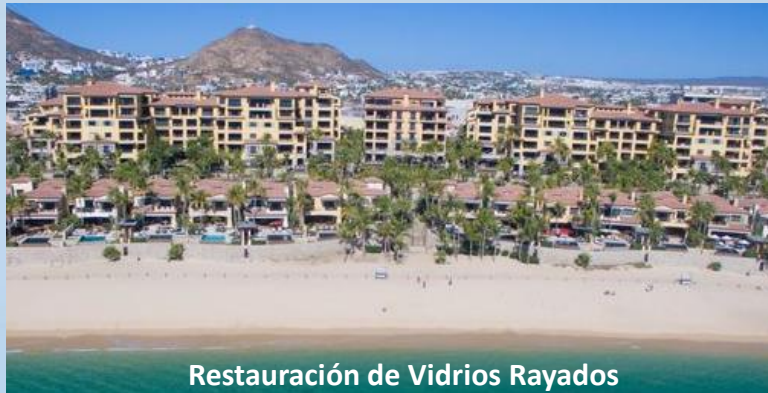
Restauración de Vidrios Rayados

Hacienda Beach Club & Residences Cabo San Lucas, B.C.S.