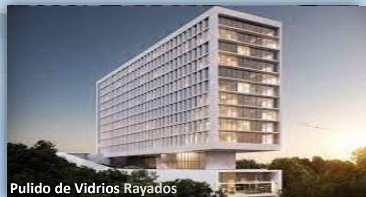
Pulido de Vidrios Rayados

Bosque 6060 Desierto de los Leones - CDMX