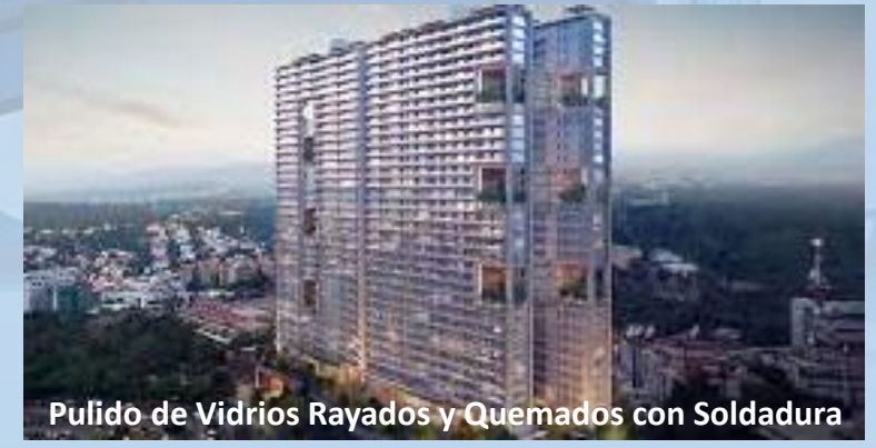
Pulido de Vidrios Rayados y Quemados con Soldadura