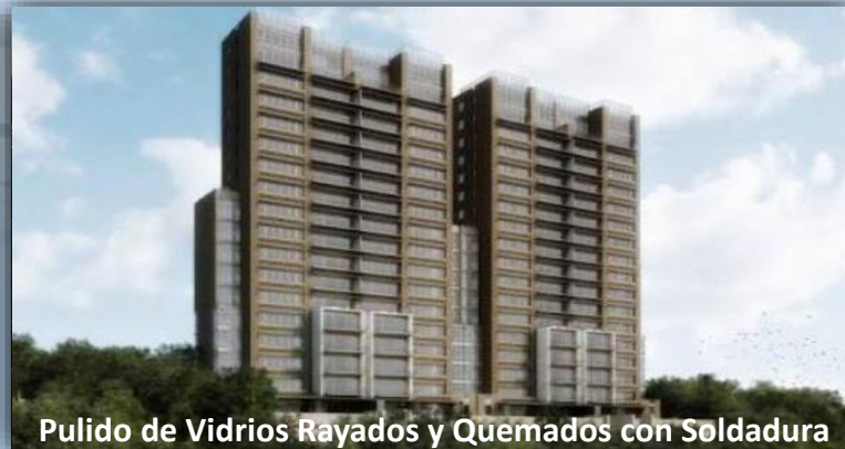
Pulido de Vidrios Rayados y Quemados con Soldadura

Bosque 6060 Desierto de los Leones - CDMX