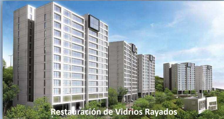
Restauración de Vidrios Rayados

Residencial Alta Vitta Lomas Verdes, Edo Méx.