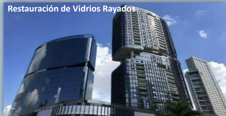
Restauración de Vidrios Rayados

Hacienda Beach Club & Residences Cabo San Lucas, B.C.S.