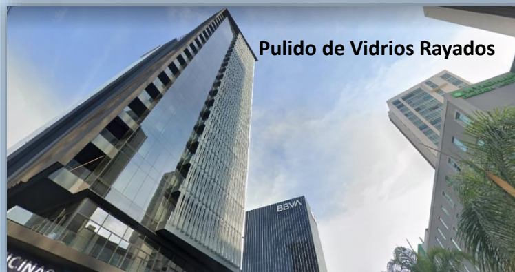
Pulido de Vidrios Rayados

Torre Panorama Acueducto Guadalajara, Jalisco.