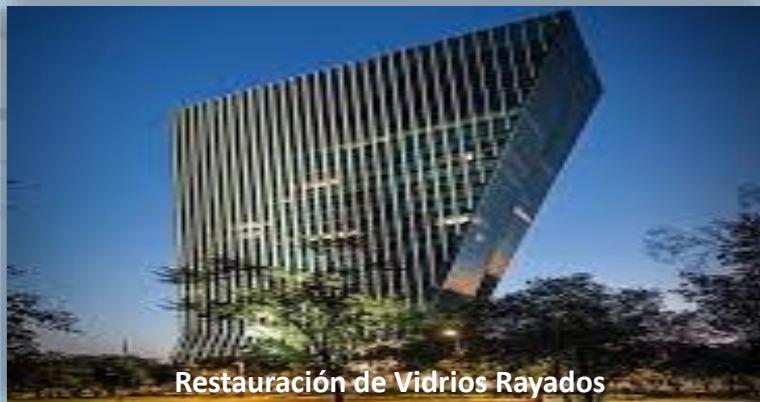
Restauración de Vidrios Rayados