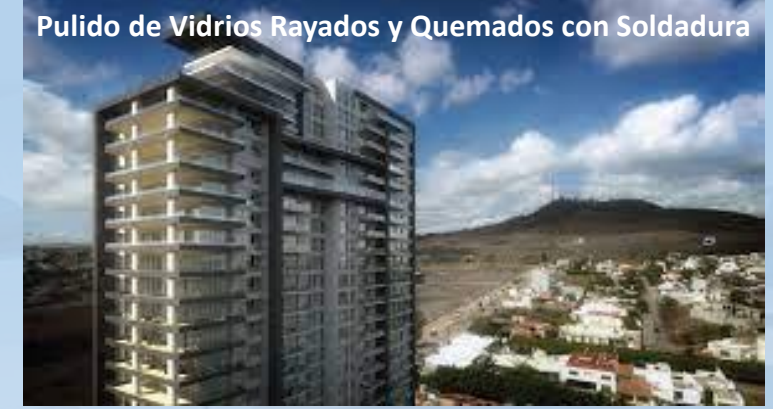
Pulido de Vidrios Rayados y Quemados con Soldadura